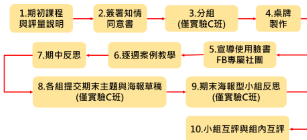
圖三、實際教學流程

小組互評是採用全班平均分組，每組 5 人為原則，同系不同組以鼓勵跨系所之交流與合作。期末小組報告當天，各組輪流上台報告海報內容與學習反思，隨即由台下各組評分與評語。全班各組對於該組之平均分數(為避免人情或報復，計分採取先去掉最高分與最低分各一之後，平均之)為該小組全體成員之基本期末分數。然後進行組內互評，也就是全組根據各成員的貢獻度，互相評量分數與評語，取最佳的前 2-3 人在期末成績加 5-10 分。