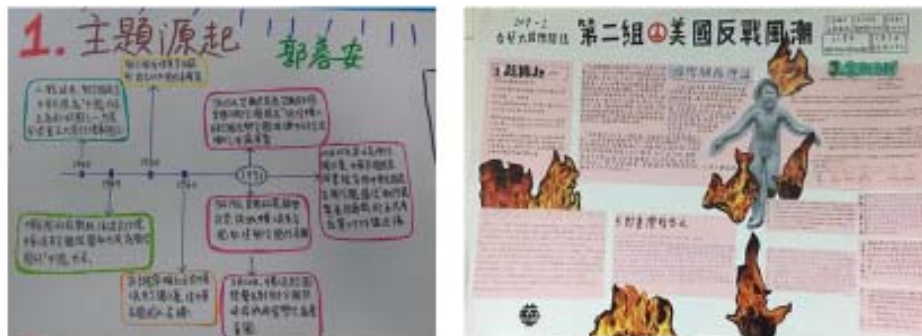
圖四、C 組期末海報型反思成果

本次教學實踐計畫執行之成果體現在期末學生回饋·不分班別均對於開拓國際視野表示非常贊同或贊同(如下圖)。